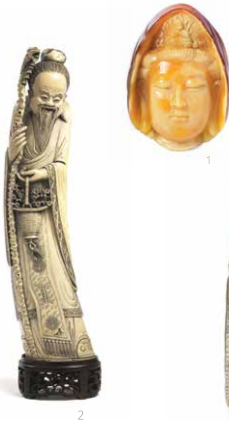
1 PENDENTE, CINA, TARDA DINASTIA QING SECC. XIX-XX

a forma di guanyin in becco di tucano; alt. cm 6